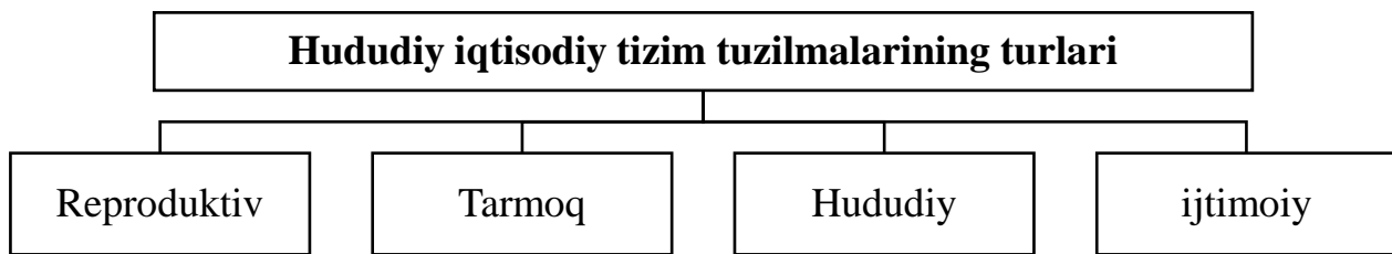
3-rasm. Hududiy iqtisodiy tizim tuzilmalarining turlari 38

Hududiy iqtisodiy tizimning alohida elementlari o'rtasidagi xususiyatlar va munosabatlarga qarab, uning tuzilishini quyidagi turlarini ajratib ko'rsatish mumkin (3-rasm).