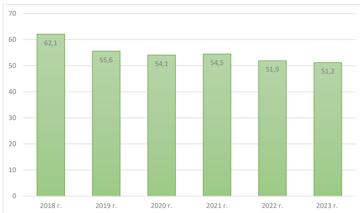
Рисунок 2. Динамика удельного веса малого предпринимательства в ВВП РУз за 2018-2023 гг., % 247

июне. Под конец года было отмечено умеренное снижение с небольшими всплесками к первоначальному уровню.