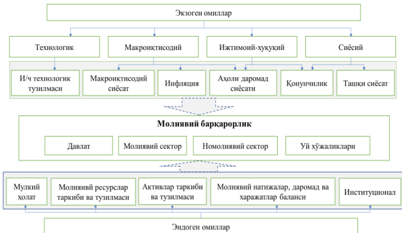
3-расм. Яҳлит ижтимоий-иқтисодий тизим молиявий барқарорлиги ва унга таъсир этувчи омиллар 192

Демак, юқоридагилар асосида умумлаштирган ҳолда қуйидаги хулосаларни тизимлаштириш мумкин, биринчидан, ижтимоий-иқтисодий тизим молиявий-иқтисодий барқарорлиги- молиявий жамғармаларни қамраб олувчи молиявий бозорлар мувозанатли ҳолати ҳисобланиб, номолиявий сектор мажбуриятларини ўз вақтида қайтариш ва кенгайтирилган такрор ишлаб чиқариш жараёни молиявий жксплуатацион эҳтиёжларини тўлиқ ҳамда ўз вақтида молиялаштириш имкониятларининг намоён бўлишидир.