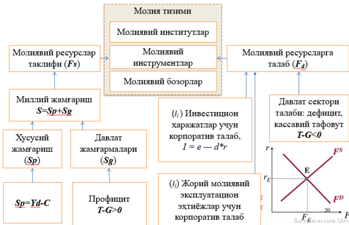
1-расм. Миллий иқтисодиётда молия тизимининг бош функционал вазифаси чизмаси 190

Нобель мукофоти совриндори Р. Мертон ва Зви Бодилар молияга пул маблағларини бошқаришга оид ижтимоий-иқтисодий муносабатлар тизими сифатида таъриф бериб, молия тизимининг элементларини институционал асосларига аниқлик киритганлигини кўришимиз мумкин. Бунда молия тизимининг барқарорлиги сиатида тизим элементларининг барқарорлигини ташки яъни дескриптив намоён бўлиши эътироф этилган. Хусусан, бунда тизим элементлари сифатида молиявий шартномалар, активлар ва рисклар алмашинуви жараёнида бевосита в билвосита иштирок этувчи бозорлар ва институтлар (Зви Боди, Роберт Мертонлар, 2007) ёки молия тизимининг институционал асосини ташкил қилувчи молиявий муассасалар ва бозорлар (С. Бэслеу, Ю. Брикхем, Л.Гитман) барқарорлиги назарда тутилган.