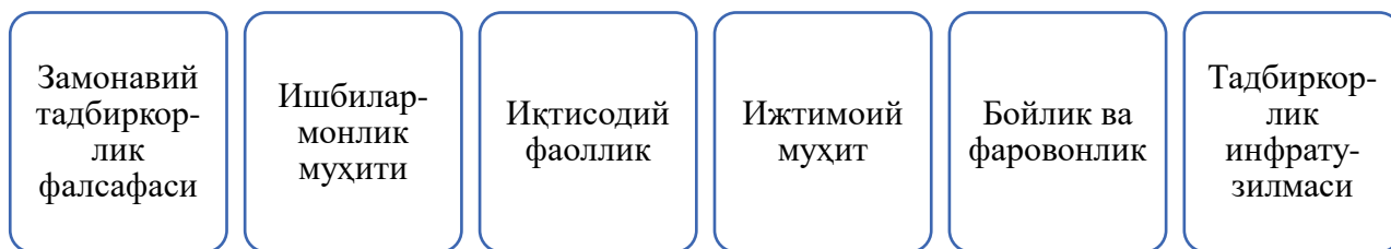
1-расм. Ишбилармонлик муҳитининг шаклланиши 127

Ишбилармонлик муҳитини шакллантириш бошқариладиган жараёнدير. Ишбилармон муҳити тадбиркорлик, кичик ва ўрта бизнес субъектлари фаолиятига тескари таъсир тадбир эмас, унинг тадбиркорлик субъектларнинг шакллантиришг борасида қулай инфра-тузилмани таркиб топтиришдан иборатдир.