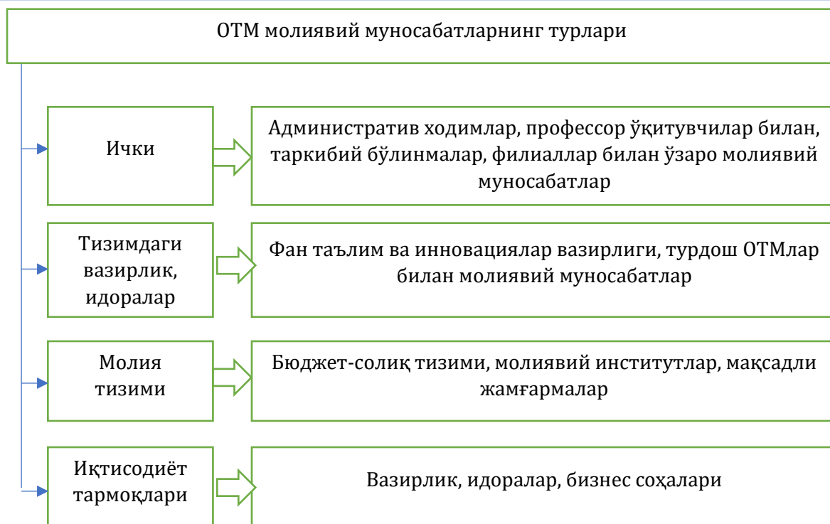
4-расм. Олий таълим муассасаларида молиявий муносабатларнинг таснифланиши 229

Бунда II харажатларнинг гуруҳига тегишли маблағ ўтказмасдан I гуруҳ харажатларини амалга ошириш тақиқланиши белгиланган. Демак, иш ҳақини ҳисоблаш ва уни тўлаш жараёнида биринчи навбатда бюджетдан ташқари жамғармаларга тўловларни амалга ошириш интизомига риоя қилишнинг ҳуқуқий мақоми келтирилган. Ягона ғазна ҳисоб рақамида, шунингдек бюджет тизими бюджетларининг даражалари бўйича тегишли ғазна ҳисоб варағида биринчи ва иккинчи гуруҳлар бўйича тўланмаган харажатлар суммасидан ортиқ маблағлар мавжуд бўлганда ортиқча сумма миқдоридан учинчи ва тўртинчи гуруҳлар бўйича харажат қилишга рухсат этилиши белгиланган.