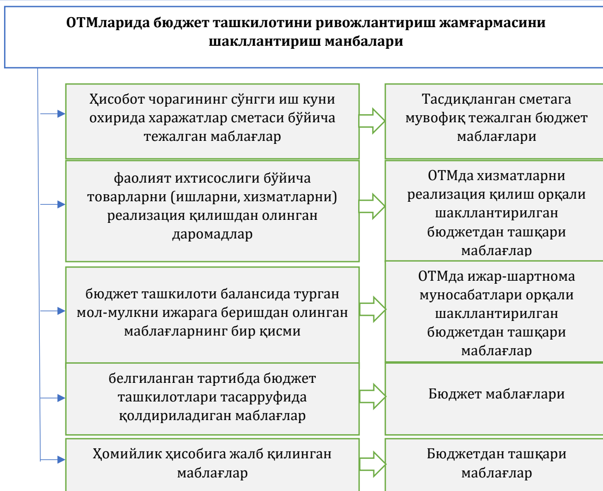
2-расм. Олий таълим муассасаларида бюджетдан ташқари ривожлантириш жамғармасини ташкил қилиш манбалари 227

Давлат олий таълим муассасалари ривожлантириш жамғармасининг навбатдаги манбаи бюджет ташкилоти балансида турган мол-мулкни ижарага беришдан олинган даромадлар ҳисобланиб, ушбу даромадлар университетлар мулкчилигининг тегишли давлат ҳокимияти органларига мансублигига қараб 50/50 нисбатда тақсимланади.