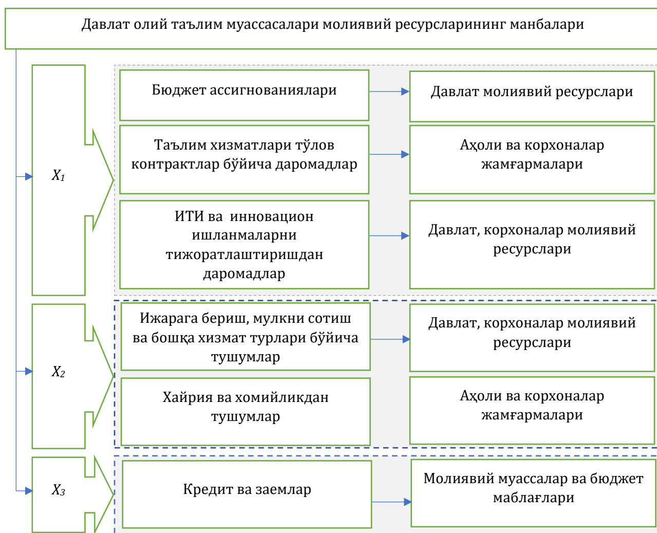
5-расм. Давлат олий таълим муассасалари молиявий ресурсларининг шаклланиш манбалари 230

Ўзбекистондаги давлат олий таълим муассасалари ташкилий ҳуқуқий шаклига кўра нотижорат ёки бюджет муассасаси мақомининг идеал шаклини ўзида мужассамлаштирмайди. Чунки улар: биринчидан, ҳар иккала ташкилий-ҳуқуқий мақомнинг молиявий элементларини ўзида мужассамлаштирган ва улар хизматларни тижорат асосида сотиш ҳуқуқига эга; иккинчидан, улар молиявий ресурсларининг шаклланишида бюджет ассигнованияларининг улуши кескин пасайиб бормоқда. Бунга сабаб, кейинги йилларда хизматларни эркин бозор механизми асосида сотиш имкониятга эга бўлган ижтимоий инфратузилма муассасалари фаолиятини либераллаштириш ва уларга тўлиқ молиявий мустақилликни бериш билан боғлиқ ислохотлар ҳисобланади.