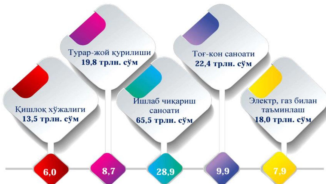
3-расм. O‘zbekiston Respublikasida iqtisodiy faoliyat turlari bo‘yicha asosiy kapitalga investitsiyalar hajmi trln. so‘m va ulushi % da 46

Keltirilgan ma'lumotlardan ham ko'rish mumkinki, sanoat ishlab chiqarishiga investitsiyalarning jalb qilinishi borasida qator imkoniyatlar yaratilganligini ko'rish mumkin. Ayniqsa, sanoat ishlab chiqarishida xorijiy investitsiyalarning roli nihoyatta katta ekanligi hech kimga sir emas. U orqali mamlakat iqtisodiyoti barqaror bo'libgina qolmay, rivojlanishda davom etadi.