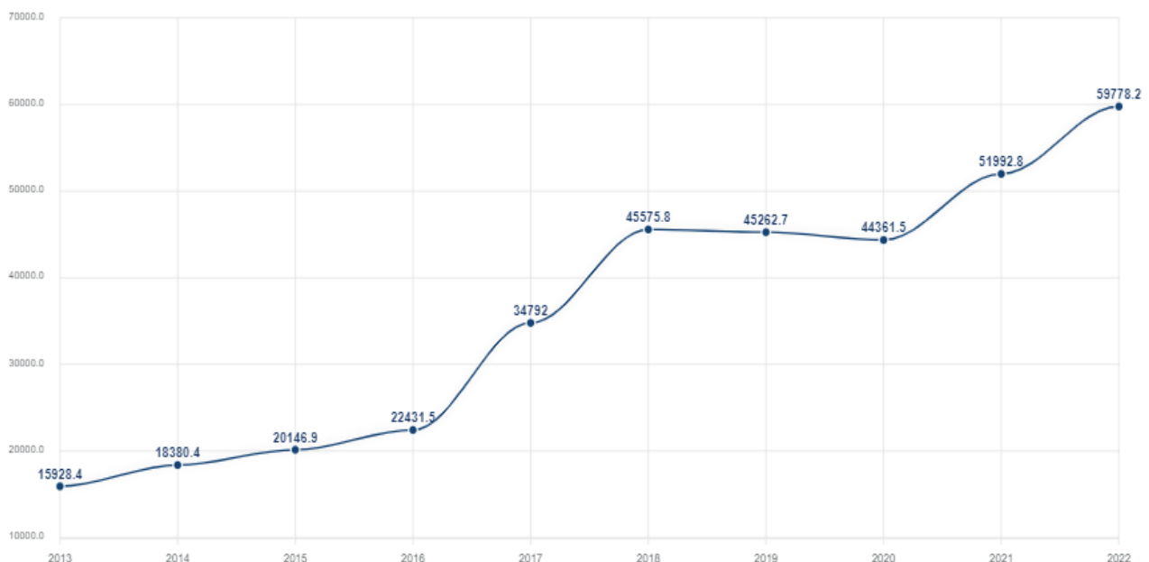
2-rasm. Mahsulotlarga sof soliqlar hajmi 10

2021-yil ma'lumotlariga ko'ra, mahsulotlarga sof soliqlarning YaIM tarkibidagi ulushi 7,2 % ni tashkil etgan bo'lib, bu ko'rsatkich 2020-yil ma'lumotlari bilan taqqoslaganda 0,2 foiz punktga, 2017-yil bilan taqqoslaganda esa 3,8 foiz punktga kamaygan 9 .