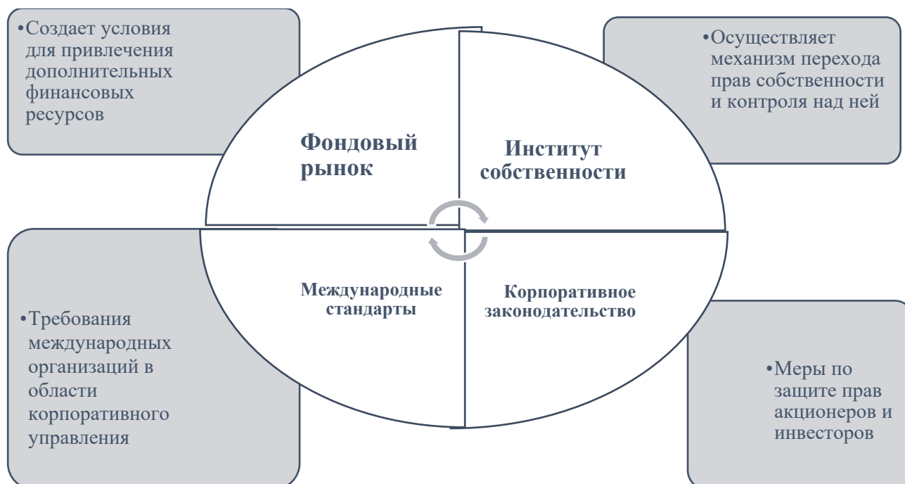
Рисунок 4 - Внешние механизмы контроля корпоративного управления

Внешние механизмы контроля корпоративного управления приведены на рис. 4.