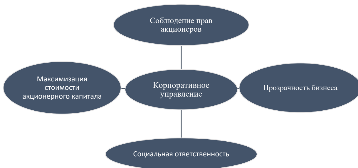
Рисунок 2. - Основные элементы корпоративного управления 61

По мнению автора, корпоративное управление направлено на поддержание баланса при решении двух основных задач: между максимизацией стоимости акционерного капитала за счет принятия эффективных управленческих решений, и соблюдением интересов всех заинтересованных сторон. Основные элементы корпоративного управления приведены на рис. 2.