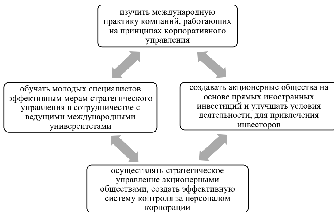
Рисунок 1. Меры по совершенствованию корпоративного управления в Узбекистане 60

Указ Президента Республики Узбекистан от 24 апреля 2015 года «О мерах по внедрению современных методов корпоративного управления в акционерных обществах», а также Постановление Президента Республики Узбекистан «О мерах по дальнейшему совершенствованию корпоративного управления в акционерных обществах с преобладающей долей государства» послужили основой для системного и более эффективного внедрения современных методов корпоративного управления (Указ, 2015). Меры по совершенствованию корпоративного управления в Узбекистане, в частности, в деятельности акционерных обществ, приведены на рис. 1.