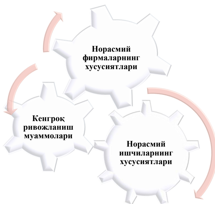
1-расм. Норасмий секторнинг хусусиятлари 104

Бугунги кунда жаҳон мамлакатлари тажрибасига қарайдиган бўлсак, норасмий сектор фаолиятини расмийлаштириш бўйича кўплаб илмий-амалий ишлар амалга ошириб келинмоқда. Ушбу тадқиқотлар доирасида эътиборга молик айрим жиҳатларини қуйидаги 1-расмда шакллантирганмиз.