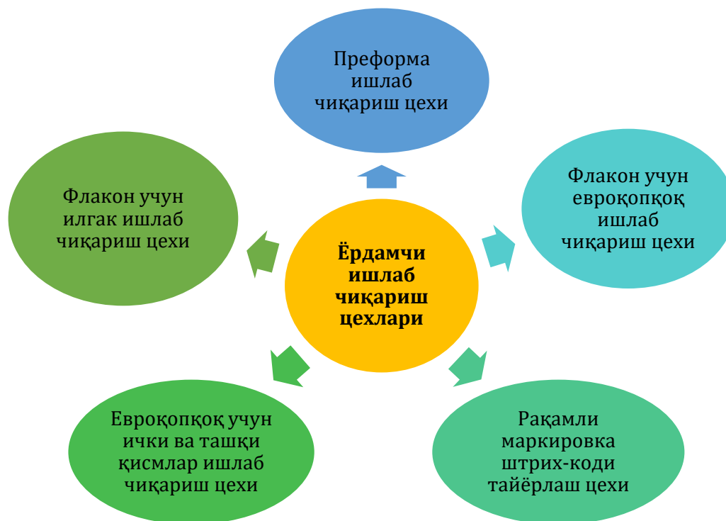
1-расм. Ёрдамчи ишлаб чиқариш цехлари

Корхоналарда асосий ишлаб чиқариш жараёнларидан аввал ёрдамчи ишлаб чиқариш жараёнлари амалга оширилади. Чунки, ёрдамчи маҳсулотлар асосий ишлаб чиқариш жараёнларини ташкил этишда асосий таъминот вазифасини бажаради. Бу ишлаб чиқариш жараёнларида қуйидаги цехлар иштирок этади (1-расм)