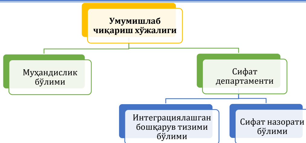
2-расм. Умумишлаб чиқариш хўжалигининг таркибий қисмлари

Корхонада муҳандислик бўлими ташкилий структурасидан кўриш мумкинки, ушбу бўлимда ишлайдиган ходимлар турли хил жараёнларда қатнашиб, улар ишлаб чиқариш жараёнида мунтазам тарзда хизмат кўрсатади.