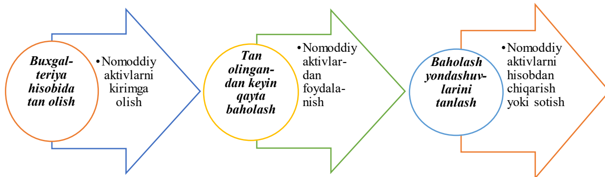
1-rasm. Qo'shma korxonalarda nomoddiy aktivlarni baholash.

Nomoddiy aktivlarni subyekt aktivlari sifatida tan olingandan keyingi baholashdan maqsad – ushbu baholanayotgan obyekt orqali daromad olishni ko'zda tutishdir. Aksariyat hollarda obyektlar qiymatini baholash nomoddiy aktivlarni hisobdan chiqarishda yoki sotishda qo'llaniladi.