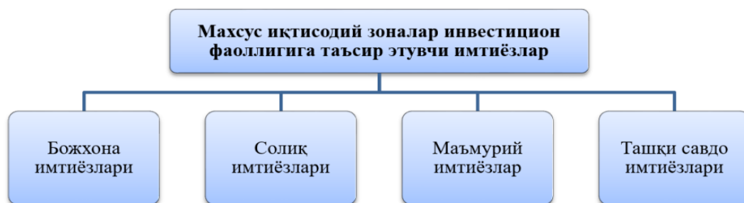
2-расм Махсус иқтисодий зоналар инвестицион фаолиятига таъсир этувчи имтиёзлар(www.xs, n.d.)

Бугунги кунда мамлакатимизда 23 та эркин иқтисодий ва 348 та кичик саноат зонаси фаолият юритмоқда. Эркин иқтисодий зоналарда умумий қиймати 2,6 миллиард долларлик 453 та лойиҳа амалга оширилиб, 36 мингга яқин иш ўрни яратилган. Кичик саноат зоналарида эса 5 триллион сўмлик 1 минг 497 та лойиҳа ишга туширилиб, 36 мингдан зиёд кишининг бандлиги таъминланган. Шу билан бирга, бу ҳудудларда ҳали имкониятлар кўп. Шу мақсадда бугун давлатимиз раҳбари “Махсус иқтисодий ва кичик саноат зоналари муҳандислик-коммуникация инфратузилмасини янада ривожлантириш чора-тадбирлари тўғрисида” қарор қабул қилди.