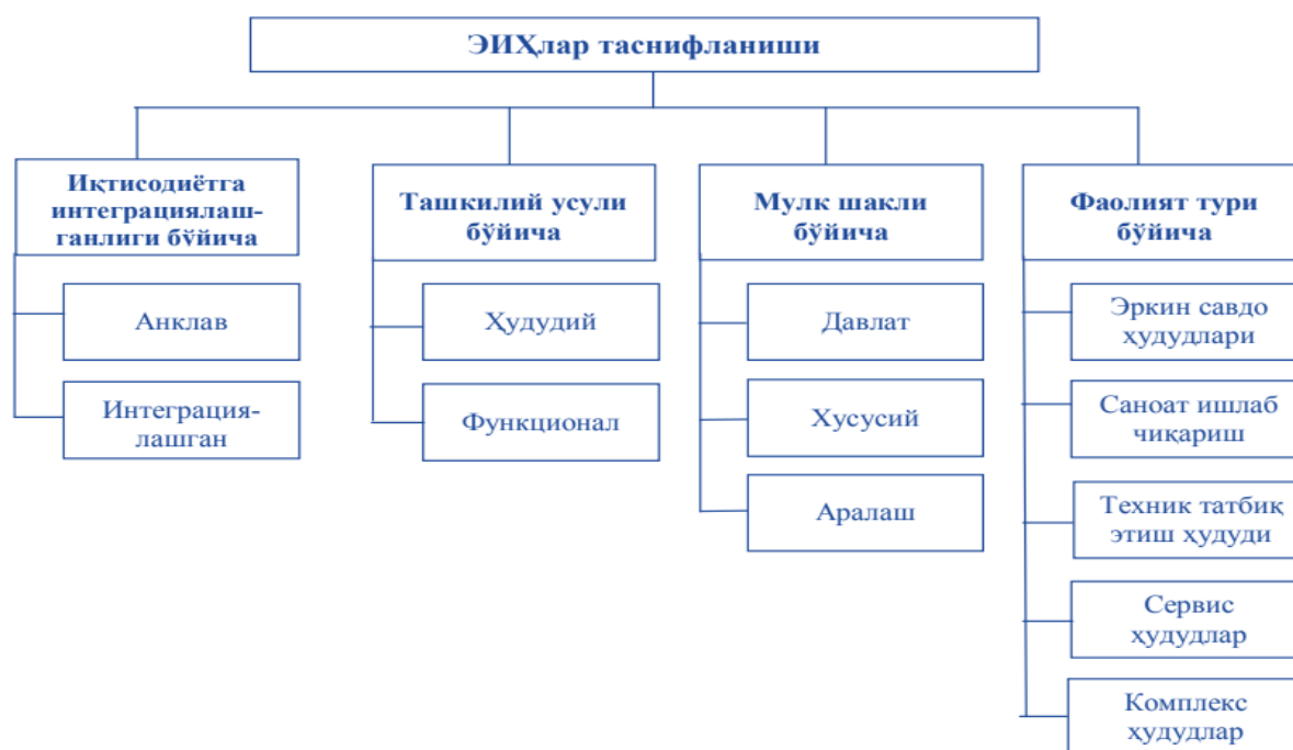
1-расм. Эркин иқтисодий ҳудудларнинг таснифланиши

ЭИХлар фаолияти ихтисослашувига кўра қуйидагича таснифланди: эркин савдо ҳудудларига – эркин божхона, эркин портлар ва божсиз савдо дўконлари; саноат ишлаб чиқариш ҳудудларига – импорт ўрнини босувчи, экспортга йўналтирилган маҳсулотлар ишлаб чиқаришга ихтисослашган ҳудудлар, экспорт-импорт ҳудудлари; техник татбиқ этиш ҳудудларига – технопарк ва технополислар; хизмат кўрсатувчи ҳудудларга – туризм ва оффшор ҳудудлар; комплекс ҳудудлар таркибига – эркин тадбиркорлик ва махсус иқтисодий ҳудудларни киритиш мумкин.