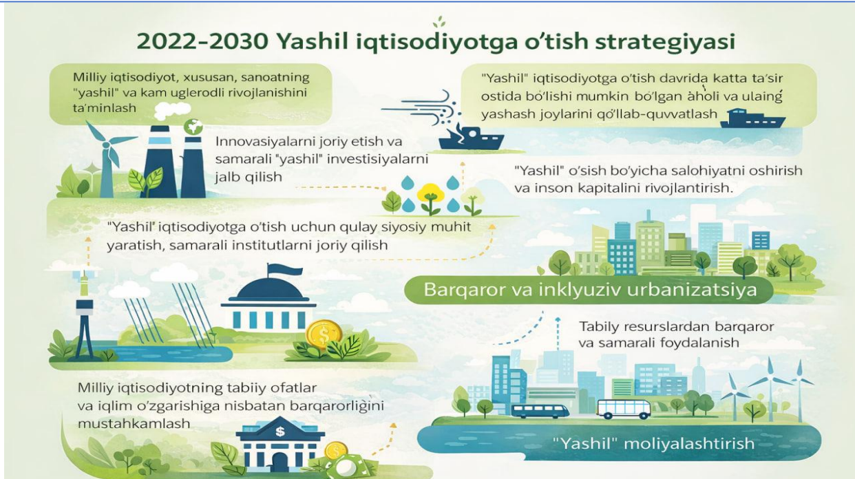
2-rasm. 2022-2030 yillarga mo'ljallangan "Yashil iqtisodiyotga o'tish strategiyasi"ning asosiy yo'nalishlari (sdgs.un.org, n.d.)

"Yashil" investitsiyalar qayta tiklanuvchi energiya, energiya samaradorligi, ekologik infratuzilma hamda resurs tejavchi texnologiyalarni moliyalashtirishga yo'naltirilgan bo'lib, Barqaror rivojlanish maqsadlarining bir qatoriga bevosita va bilvosita xizmat qiladi. Xususan, "yashil" investitsiyalar BRM 7, 9, 11, 12, 13, 14 va 15 maqsadlariga bevosita, BRM 3, 6 va 8 maqsadlariga esa bilvosita ta'sir ko'rsatadi. Shu bois "yashil" investitsiyalar BRMlarni amalga oshirishning muhim moliyaviy instrumentlaridan biri sifatida namoyon bo'ladi.