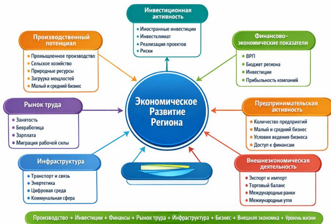
Рисунок 1. Экономические факторы, определяющие уровень развития региона

Существенное значение имеет наличие логистических центров и доступ к международным транспортным коридорам (развитие энергетической инфраструктуры), а также уровень цифровой инфраструктуры (доступ к интернету, наличие IT-парков).