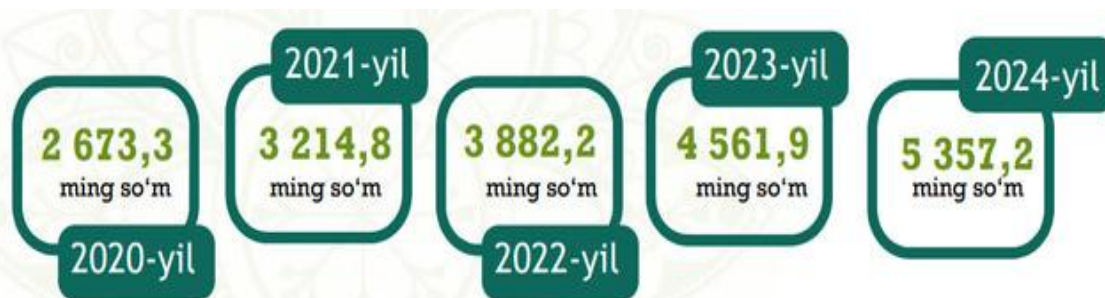
5-rasm. 2020-2024 yillarda O'rtacha oylik ish haqining yillar kesimidagi dinamikasi (yanvar-dekabr)

Aholining real daromadlarini Respublika aholisi bo'yicha tahlil qiladigan bo'lsak, 2024-yilda O'zbekistonda o'rtacha nominal ish haqi 5,37 mln so'mdan oshdi, bu 2023-yilga nisbatan 17,4% ko'p. Bu, shuningdek, so'nggi etti yildagi eng past o'sish sur'ati (pandemiyali 2020-yildan tashqari). Toshkent shahrida ushbu ko'rsatkich 9 mln so'mdan ortdi (+21,4%). O'qituvchi va shifokorlarning maoshi sekinroq o'smoqda.