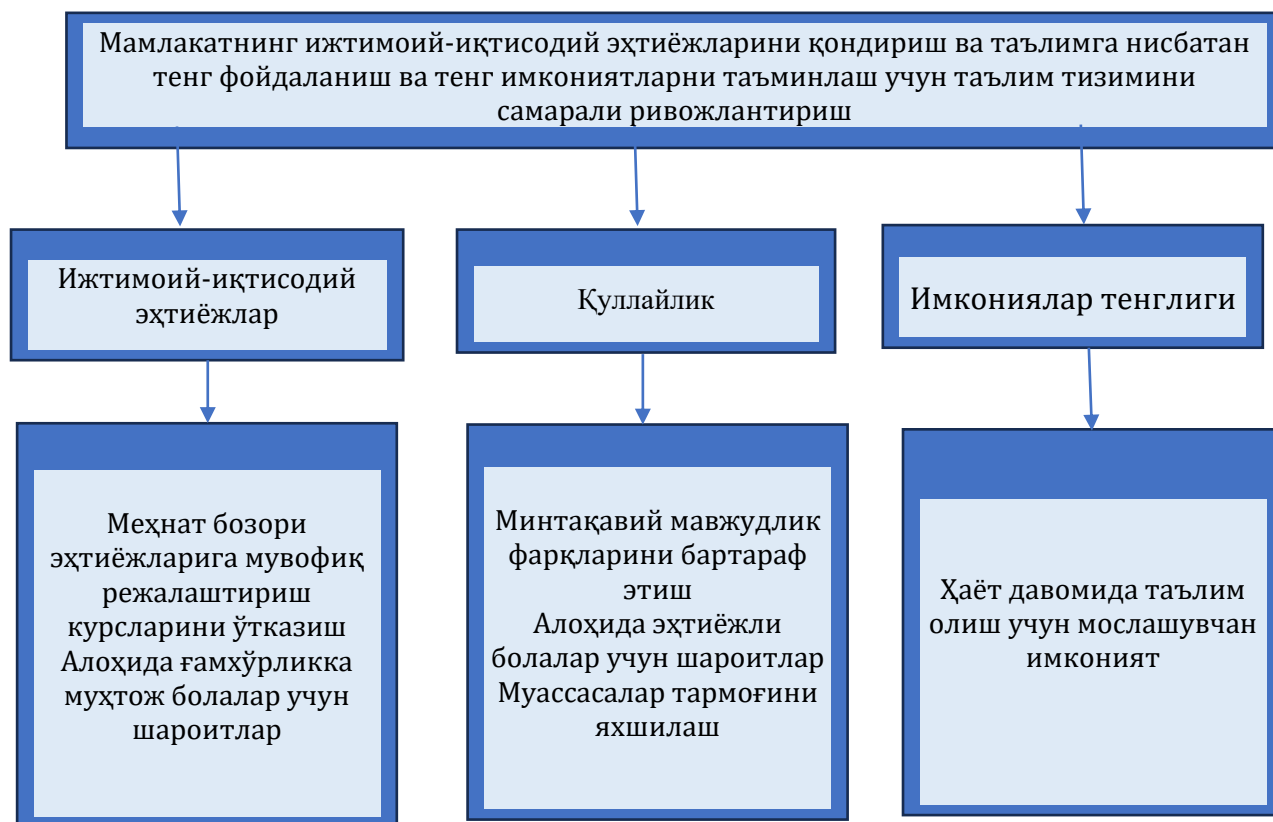
3-расм. Вазифалар билан боғлиқ мақсадлар (Таълим вазирлиги мисолида)

Натижа: Сув тежаш орқали қишлоқ хўжалик маҳсулотлари ҳосилдорлигини ошириш. Масалан, Фарғона водийсида НҲВ асосида ўтказилган лойиҳаларда томчилатиб суғоришдан фойдаланган фермерлар ҳосилдорликни 20–30% га оширишга эришди.