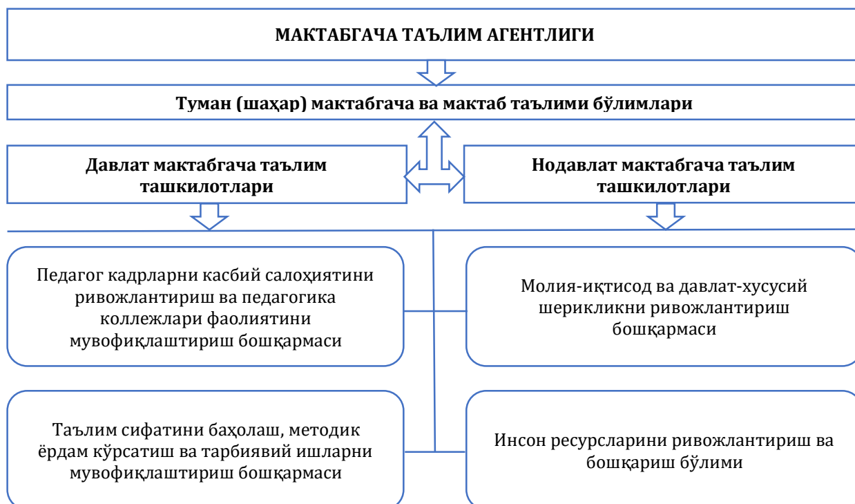
3-расм. Мақтабгача таълим агентлиги структураси

Юқорида келтирилган расм асосида кўриш мумкинки, Мақтабгача ва мактаб таълими вазирлиги йирик структурага эга ташкилот ҳисобланиб, унинг таркибий тузилмасига таълим хизматларини назорат қилиш фаолияти билан шуғулланадиган барча ташкилотлар киради.