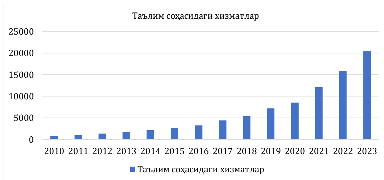
1-расм. 2010-2023 йилларда Республикада таълим соҳасидаги хизматлар бўйича кўрсатилган хизматлар ҳажми, млрд. сўмда

Бугунги кунда, нодавлат таълим ташкilotлари томонидан амалга ошириладиган хизматлар ҳажми кундан-кунга ошиб, ушбу ташкilotларнинг мамлакат миқёсидаги ўрни ва аҳамияти ҳам тобора ортиб бормоқда. Статистика маълумотларига аҳамият бериб қарайдиган бўлсак, таълим соҳасидаги хизматлар ҳажми 2010 йилда 763,1 млрд сўмни ташкил этган бўлса, 2023 йилга келиб ушбу кўрсаткич 20 418,4 млрд сўмни ташкил этмоқда. Мамлакатимизда иқтисодий фаолиятнинг таълим соҳасидаги хизматлар турлари бўйича кўрсатилган хизматлар ҳажмининг йиллар кесимидаги улушини қуйидаги расм орқали кўриб чиқамиз: