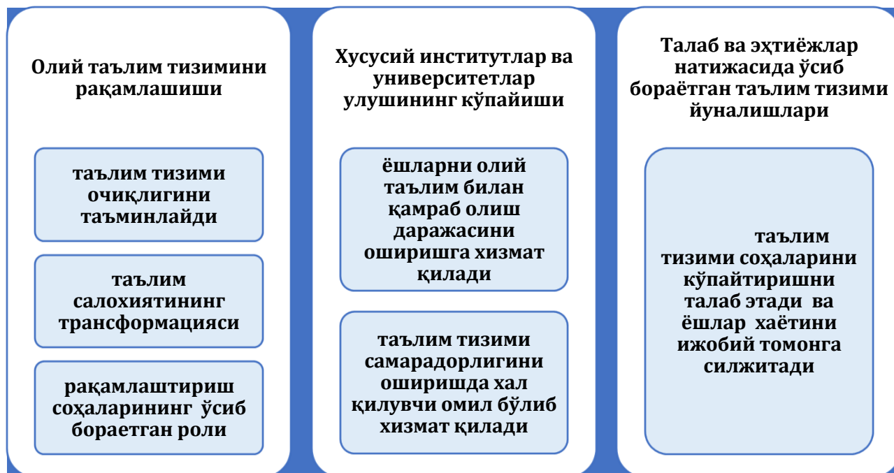
1 – расм. Олий таълим тизими хусусиятлари

Олий таълим тизими қуйидаги хусусиятлари билан ажралиб туради: