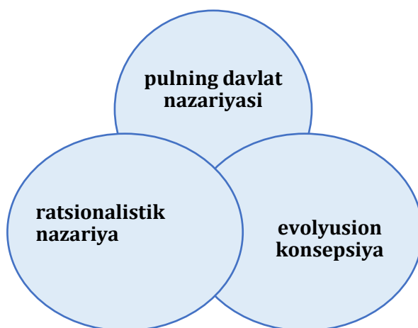
2-rasm. Umumiy pul nazariyalari