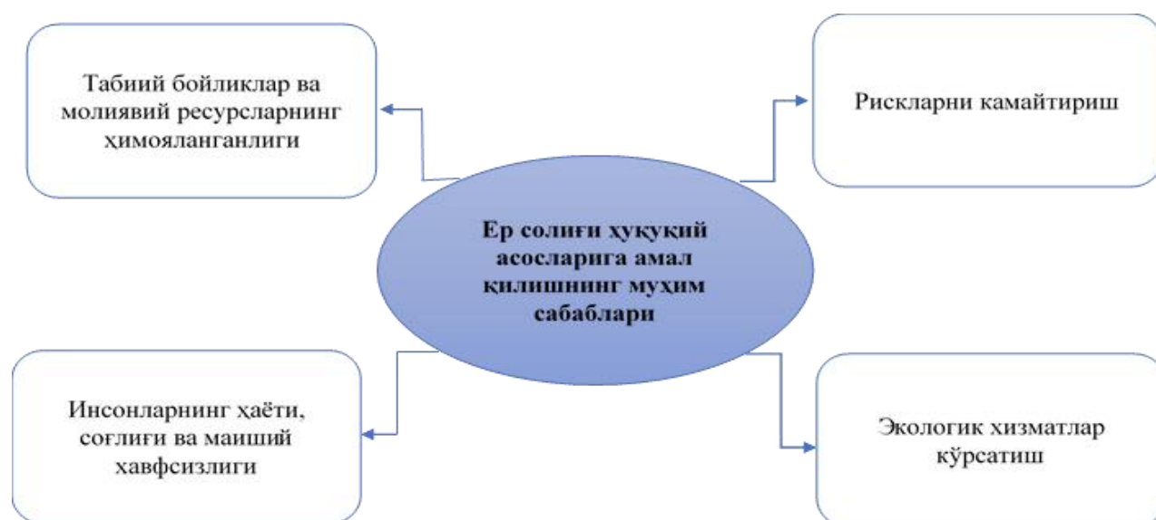
2-расм. Ер солиғи ҳуқуқий асосларига амал қилишнинг муҳим сабабларининг тавсифи 61

Ер солиғи ҳуқуқий асосларга амал қилишнинг муҳим сабаблари қуйидагилардир: