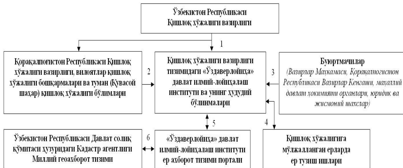
3-расм. Қишлоқ хўжалигига мўлжалланган ерларда ер тузиш ишларини амалга ошириш схемаси 64

Шу билан бирга юқоридаги қарорга биноан ишлоқ хўжалигига мўлжалланган ерларда ер тузиш ишларини амалга ошириш схемаси тасдиқланди.