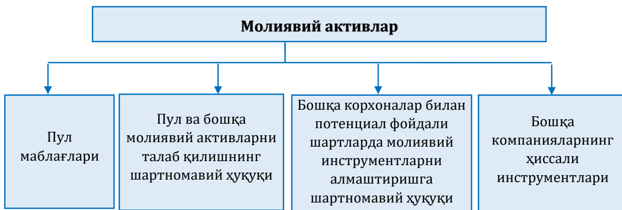
1-расм. Молиявий активларнинг таркиби (Боронов,2020)

Воликов, Помыткина (2020) “Ташкилотнинг пул маблағлари – корхона кассасидаги нақд, банкдаги лицевой сётлардаги пуллар, шунингдек нақдлаштирилмаган кўринишдаги қимматбаҳо қағозлар” деб тавсифлайди.