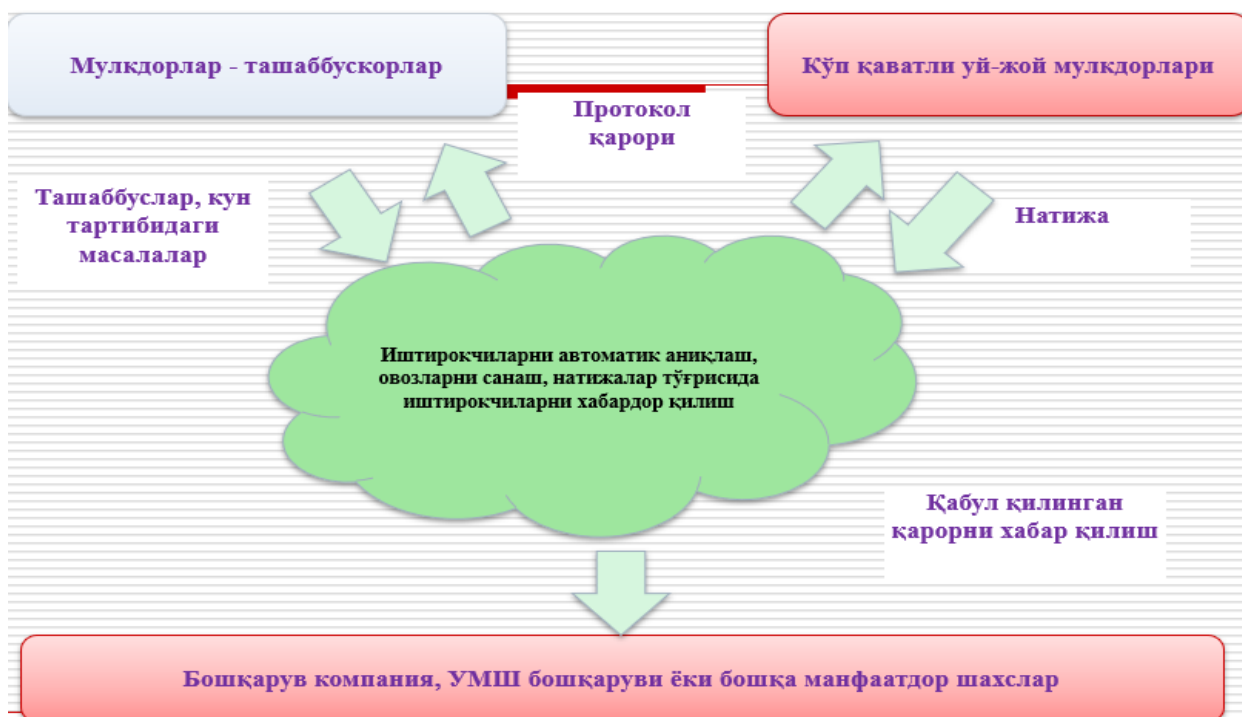
2-расм. Замоновий уй-жой фонди бошқарув компанияларининг Блокчейн – технологиясини қўллаш орқали бошқарувни оптималлаштириш жараёни тавсифи

2024-2030 йилларда кўчмас мулк бозорида глобал бизнес жараёнларини бошқариш мослашувчан тадқиқот ҳисоботлари турларини (жойларда булутли) ва иловаларни: жараёнларни такомиллаштириш, автоматлаштириш, контент, ҳужжатларни бошқариш, мониторинг ва оптималлаштириш шунингдек, мижозларнинг эҳтиёжларини, истак-ҳохишлари ва имиджларини тоифаларга ажратишни ўз ичига олган кенг қамровли таҳлилни ўз ичига олади. (2 расм) Шунингдек, рақобатчилар таҳлилинини ўтказиш ва кўчмас мулк бозори ҳажмида бизнес жараёнларини бошқаришни баҳолаш, саноат тенденцияларини ўрганиш ва ўсиш потнциалини баҳолашни ўз ичига олади.