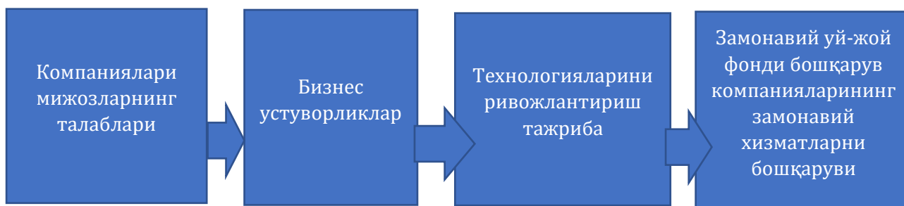
1-расм. Замонавий уй-жой фонди бошқарув компанияларининг замонавий хизматларни бошқаруви

Замонавий хизматларни бошқариш - бу IT инфратузилмасини бошқаришнинг янги ёндашувидир. Бунда бошқарув компаниялари мижозларнинг талаблари ва бизнес устуворликларининг доимий ўзгариши орқали технологияларини ривожлантиришда тажриба бўшлиқларини тўлдириш имконини беради. Бироқ, замонавий хизматларнинг турли хилда бўлиши, уй-жой бошқаруви таклифларининг ўзгаришини кўрсатади (1-расм.)