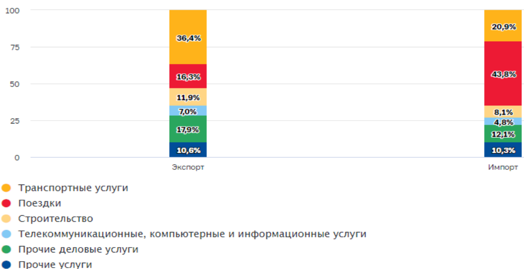
Рисунок 1. Структура экспорта и импорта услуг в России, 2023 г., в % к общему объёму

В составе экспорта услуг львиную долю занимают транспортные услуги (43,2%), поездки (туризм) (41,4%), телекоммуникационные, компьютерные и информационные услуги (8,5%), прочие деловые услуги (3,1%). В то же время на прочие услуги (3,8%) наибольшая доля соответственно приходится на услуги страхования и пенсионного обеспечения (1,6%), финансовые услуги (1,2%), государственные товары и услуги (0,5%) и др.