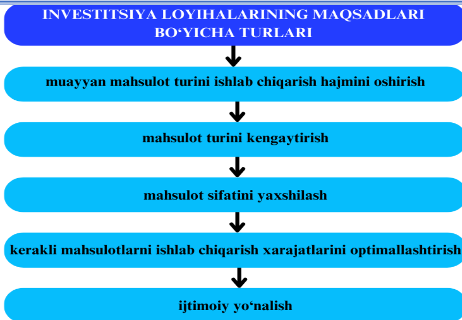
1-rasm. Investitsiya loyihalarining maqsadlari bo'yicha turlari