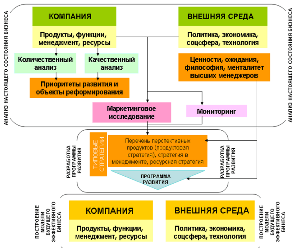
Рисунок 1. Стратегии развития малого бизнеса 22

Технологическая инфраструктура считается важнейшим фактором инноваций и конкурентоспособности. Интеграция цифровых инструментов и платформ в бизнес-процессы может повысить эффективность, снизить затраты и открыть новые возможности для роста. В ходе обсуждения было подчеркнуто, что государственная политика должна быть направлена на улучшение доступа к широкополосному Интернету, повышение цифровой грамотности и поддержку внедрения новых технологий, таких как искусственный интеллект и блокчейн, в малом бизнесе. Поощрение партнерских отношений между технологическими фирмами и малыми предприятиями также может ускорить распространение технологических инноваций. Мы можем показать наиболее подходящие стратегии развитие малого бизнеса в рисунке 1.