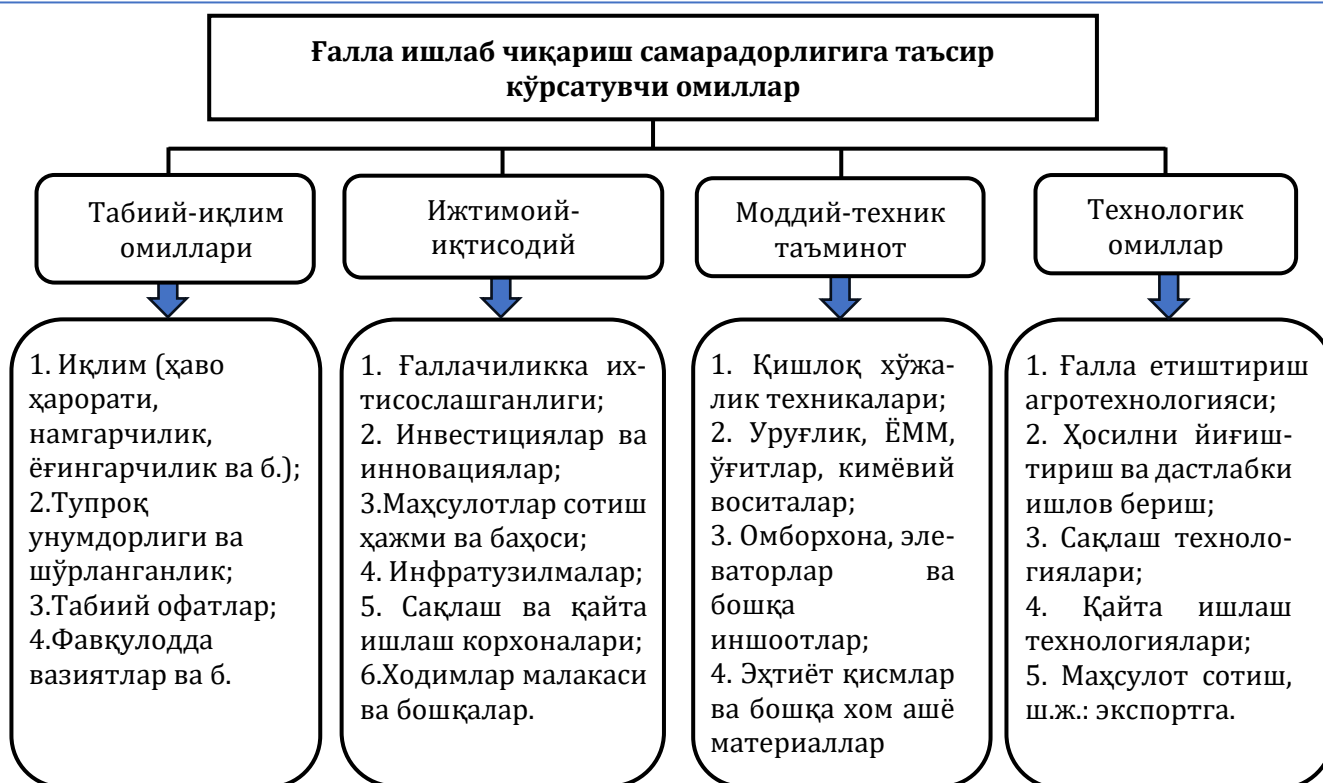
1-расм. Ғаллачилик кластерларини ташкил этиш шароитида ишлаб чиқариш самарадорлигини белгиловчи омиллар

Ушбу шарт-шароитлардан келиб чиқиб, қуйидаги саволларга жавоб беришга тўғри келади: мазкур ҳудудда ўсимликчиликни ривожлантириш мумкинми, ўсимликчиликнинг қайси турини танлаш мумкин, қандай навларни танлаш мақсадга мувофиқ, қандай агротехнологиялар қўлланилади ва ҳ.к. Мамлакатимизнинг минтақаларида ўсимликчилик ҳар хил ривожланган.