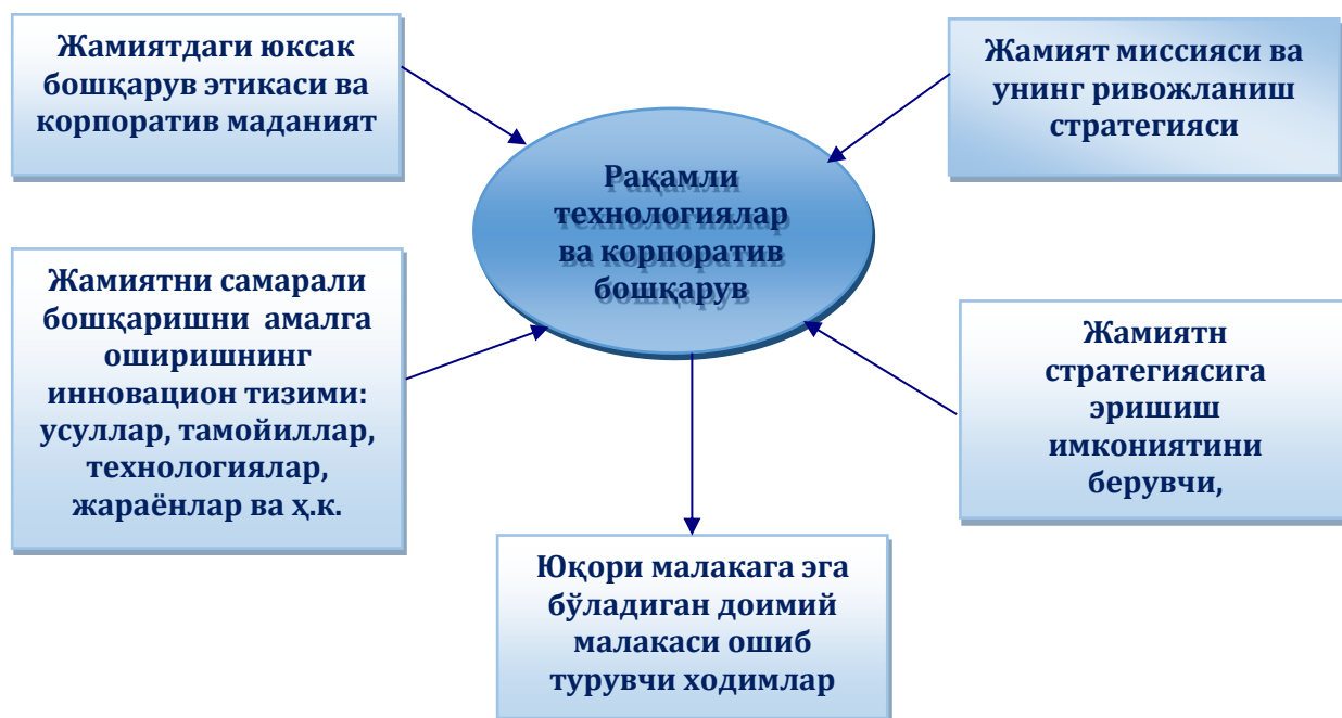
3-расм. Акциядорлик жамиятларида корпоратив бошқарув самарадорлигини баҳолаш омиллари

2. Компания фаолият натижаларини харктерловчи молиявий-иқтисодий кўрсаткичлари. Бу кўрсаткичларга: компания томонидан ишлаб чиқарилган маҳсулотлар ёки кўрсатилган хизматлар сотуви хажми ва динамикаси, солиқ ва солиққа тортишгача бўлган фойда хажми ва динамикаси, устав капиталнинг динамикаси, акциядорлик капиталнинг рентабельлик даражасининг ўсиши, бошқарув аппарати ходимларининг меҳнат унумдорлиги, компания акцияларининг дивидент даромадлиги, компания бозор қийматининг даражаси ва унинг динамикаси.