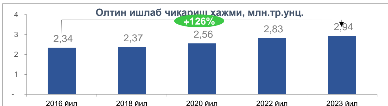
1-расм. Навоий кон-металлургия комбинати томонидан 2016-2023 йилларда олтин ишлаб чиқариш динамикаси

Бунинг эвазига комбинатда 2017-2023 йиллар мобайнида 15 243 та янги иш ўрини яратилиб, 2016 йилга нисбатан маъдан қазиб олиш ҳажми 2,5 баробар, маъданни қайта ишлаш 1,6 баробар, олтин ишлаб чиқариш 26 фоизга , кумуш эса 47 фоизга ошди (1-расм).