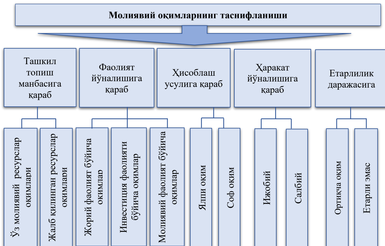
1-расм. Молиявий оқимларнинг таснифланиши

Суғурта компанияларининг молиявий оқимлари ҳар доим муайян ҳуқуқий ҳужжатлар, миллий норматив ҳужжатлар ва суғурта компанияси фаолиятини тартибга солувчи стандартлар асосида шаклланади ва ишлатилади.