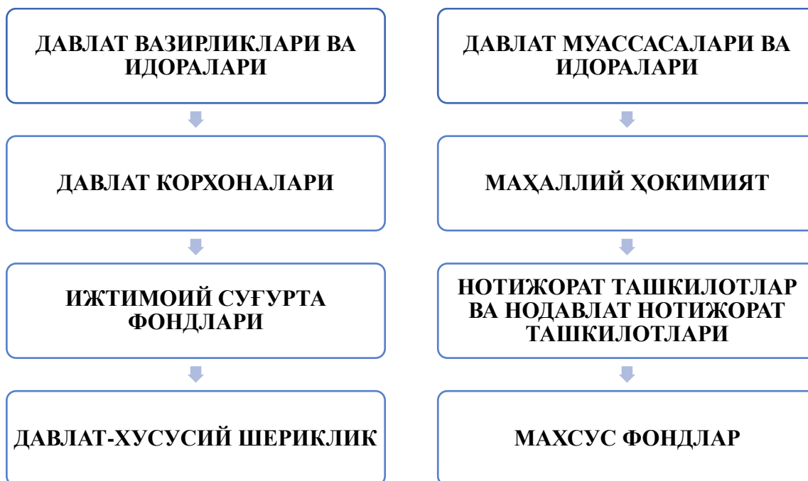
2-расм. Давлат бюджет ташкилотларининг умумий кўриниши 46

Бюджет ташкилотлари давлат секторида фаолият юритадиган ва давлат товарлари ва хизматларини етказиб бериш учун молиявий ресурсларни бошқариш ва улардан фойдаланиш учун масъул бўлган турли хил субъектларни ўз ичига олади.