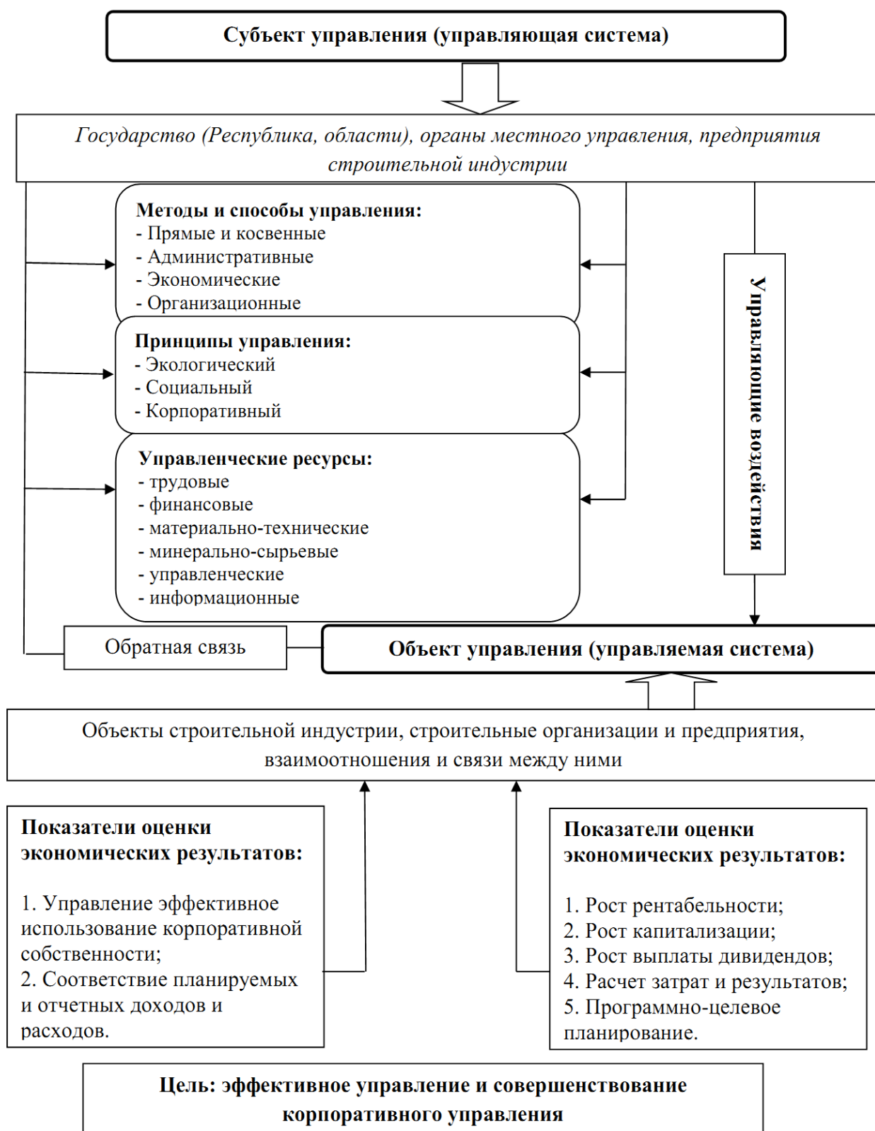
Рисунок 2. Структура организационно-экономического механизма управления в строительной индустрии 154

равноправию женщин в сфере строительства играют важную роль в формировании справедливого и разностороннего общества. Кроме того, улучшение социальной инфраструктуры в районах строительства способствует повышению качества жизни местных жителей и созданию благоприятной среды для развития общества в целом.