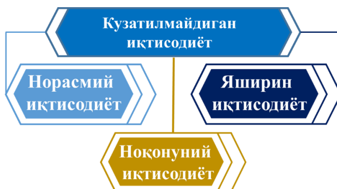
1-расм. МХТ услубиёти бўйича кузатилмайдиган иқтисодиётнинг таркибий қисмлари 140

Иқтисодий ҳамкорлик ва ривожланиш ташкилотининг “Кузатилмайдиган иқтисодиётни баҳолаш бўйича қўлланма”сига асосан “кузатилмайдиган иқтисодиёт” тушунчаси доимий статистик кузатувларда тўлиқ ёки қисман қамраб олинмаган, шунингдек, статистик кўрсаткичларда акс эттиришда билвосита усуллар орқали баҳоланадиган иқтисодий фаолият сифатида таърифланади 139 . Ўз навбатида, кузатилмайдиган иқтисодиёт норасмий, яширин ва ноқонуний иқтисодий фаолият турлари бўйича гуруҳларга ажратилади.