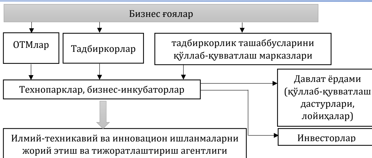
1-расм. Тадбиркорликни қўллаб-қувватлаш инфратузилмаси орқали бизнес ғояни амалга ошириш схемаси 118

Учинчи босқичда тижоратлаштириш лойиҳаларни молиялаштиришда давлат ҳисоби ёки инвесторларга йўналтириш орқали инновацион инфратузилмаларидан самарали фойдаланиш имконияти ошади.