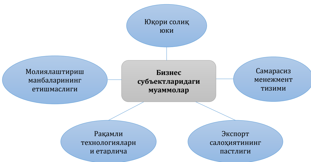
2-расм. Бизнес субъектларидаги асосий муаммолар 264

Анъанага кўра, бизнес субъектларида молиявий бошқарувнинг асосий муаммоларидан бири молиявий ресурсларнинг етишмаслиги туфайли қўшимча қарз маблағларини жалб қилиш зарурати ҳисобланади. Кўплаб тадқиқотларда келтирилишича, кичик бизнес субъектларида қарз капитали мулкни шакллантиришнинг барча манбаларининг 85 фоизини ташкил қилади (2-расм).