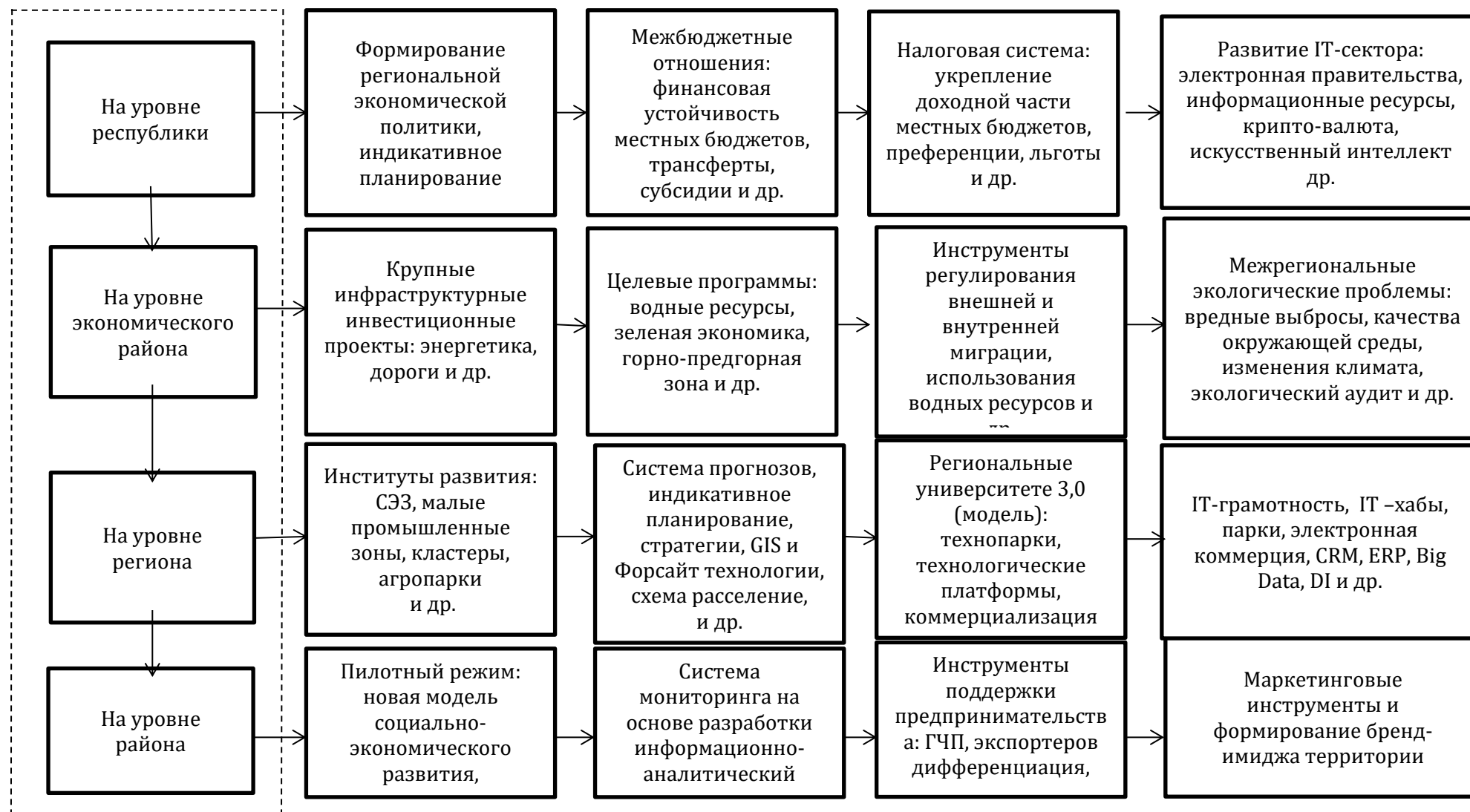
Рис.1.2.2 Иерархия инструментов и методов регулирования регионального развития в условиях децентрализации 231