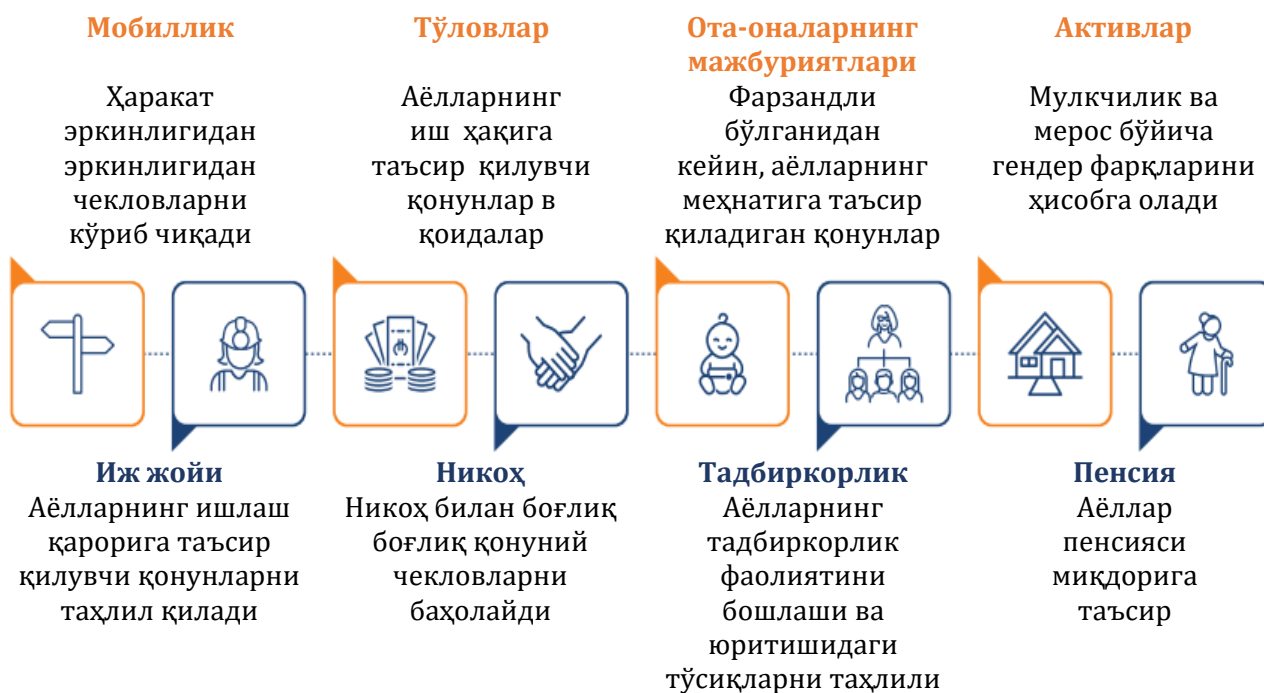
1-расм. “Аёллар, бизнес ва ҳуқуқ” эркаклар ва аёллар ўртасидаги иш ҳаётининг турли босқичларида ҳуқуқий фарқларни ўлчайдиган саккизта кўрсаткич 121

Хукумат, хусусий сектор ва фуқаролик жамияти ушбу асосдан аёлларнинг иқтисодий имкониятларини кенгайтиришдаги тўсиқларни аниқлаш ва олиб ташлаш, ишчи кучи ва тадбиркорликда иштирок этишни рағбатлантириш учун фойдаланиши мумкин.