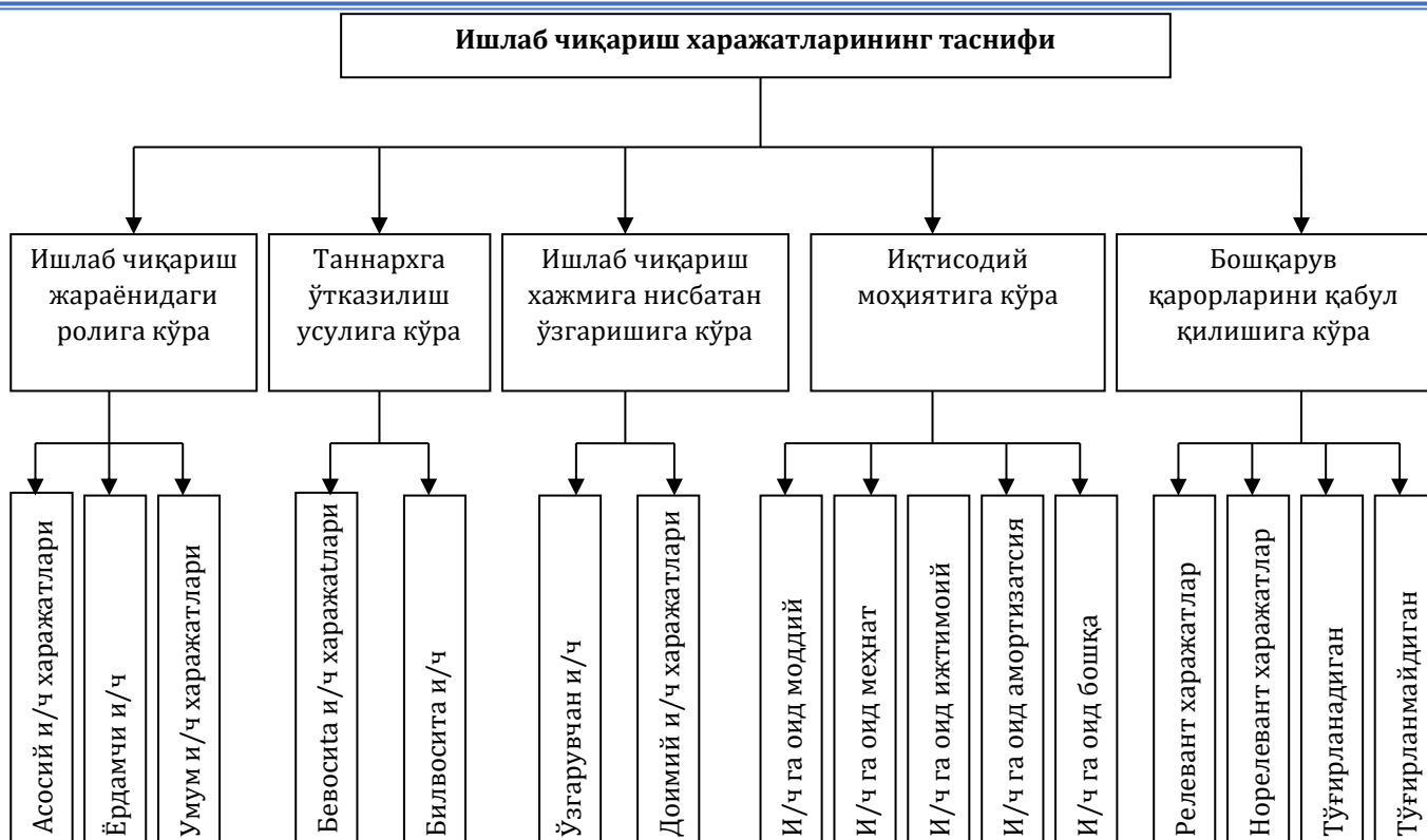
2-расм. Ишлаб чиқариш харажатларининг таснифланиши (Ғуломова, 2015)

Маҳсулот (иш ва хизмат)лар ишлаб чиқариш таннархига бевосита маҳсулот (иш ва хизмат)ларни ишлаб чиқариш билан боғлиқ бўлган, ишлаб чиқариш технологияси ва уни ташкил этиш билан шартланган харажатлар киритилади.