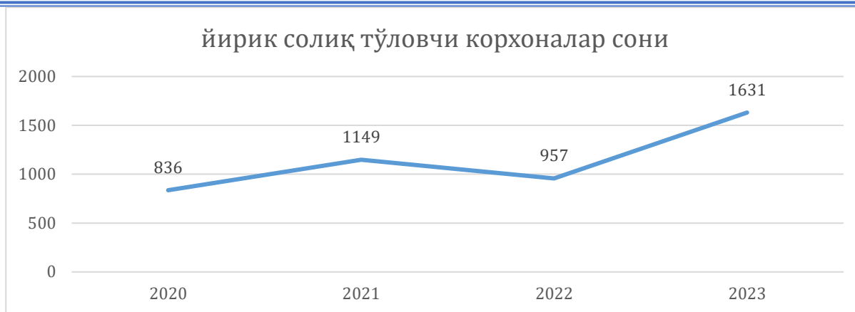
2-расм. Ўзбекистонда йирик солиқ тўловчилар тоифалари кирувчи корхоналар сонининг динамик ўзгариши таҳлили 144

Аксарият ҳолларда, йирик солиқ тўловчиларни ажратишда амалдаги мезонларнинг д- бандига асосан маҳсулот (товар, иш ва хизмат) ларни сотишдан олинган соф тушуми ўтган календарь йил якуни бўйича 100,0 миллиард сўмдан юқори бўлган ёки кетма-кет келадиган ўн икки ойлик давр якуни бўйича ушбу миқдордан ошган юридик шахслар, чет эл юридик шахсларининг Ўзбекистон Республикасидаги доимий муассасалари (бўлинмалари) йирик солиқ тўловчилар бўйича ҳудудлараро солиқ инспекциясининг солиқ тўловчиси сифатида рўйхатга киритилади. Мазкур мезон бўйича солиқ тўловчиларни ажратишда нафақат соф тушум, балки корхоналарнинг жами активлари қиймати, рентабеллик даражаси ҳамда унинг молиявий аҳволи ҳам жуда муҳимдир. Шу нуқтаи назардан йирик солиқ тўловчилар тоифаси бўйича мезоннинг д кичик бандини қайта кўриб чиқиш мақсадга мувофиқ бўлади.