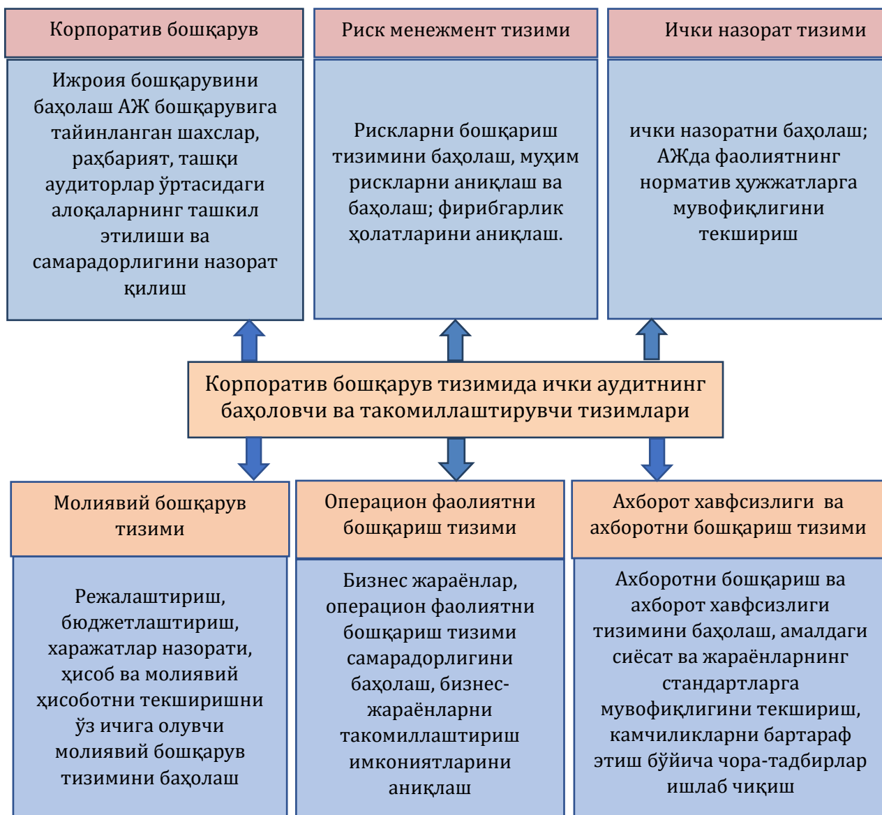
1-расм. Корпоратив бошқарув тизимида ички аудитнинг баҳоловчи ва такомиллаштирувчи тизимлари 97

Ушбу жадвалдан кўришимиз мумкинки, корпоратив бошқарув йирик корпорацияларни тўғри ва самарали бошқариш тизими бўлиб, бунда ички аудит манфаатлар мувозанатини сақлашга, унинг рискларини камайтиришга, ички назорат самарадорлигини, бозор қийматини оширишга, акциядорлар, Кузатув Кенгаши мақсадларига эришишга ёрдам берувчи инструмент сифатида намоён бўлади.