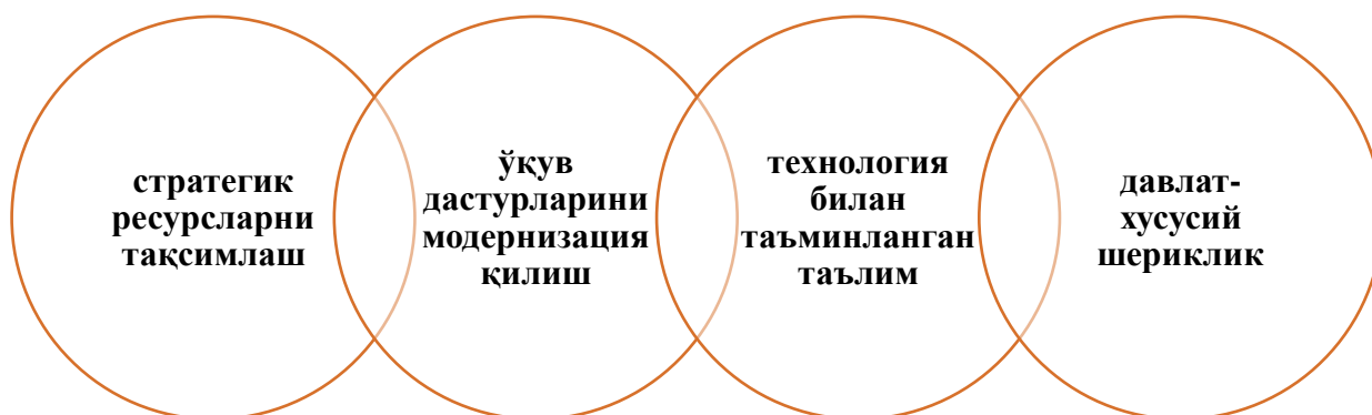
2-расм. Харажатларни оптималлаштириш учун ечимлар 97

Сўнги яна бир долзарб масала технологик харажатларни бошқаришда ўқитиш жараёнига технологияни интеграция қилишни мувозанатлаш ҳаракатидир. Профессional таълим муассасалари рақамли ресурслар ва инфратузилмани харид қилиш ва сақлашда қийинчиликларга дуч келмоқда. Энди бу муаммоларни ечимларини келтириб ўтсак (2-расм).