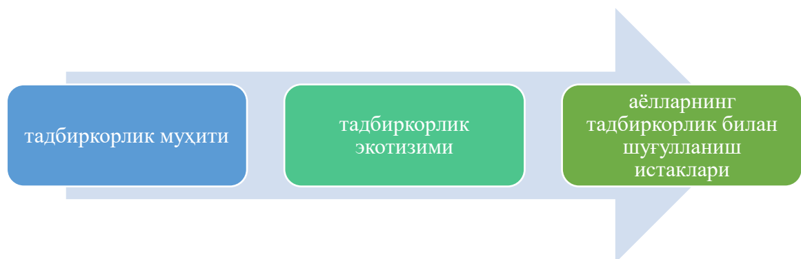
2-расм. Аёллар тадбиркорлиги Глобал индексида аёллар тадбиркорлигини ўлчовчи асосий омиллар 49

"Аёллар тадбиркорлиги Глобал индекси" бутун дунёда аёллар тадбиркорлиги ривожини истиқболларини ўлчаб беради. (2-расм)