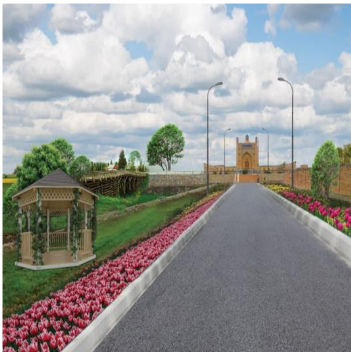
Yaqin yillarda Hazrat Niyoz Xorazmiy maqbaralarini shu ko‘rinishga keltirish rejalashtirilgan

Maqbara yonidagi qabristonda “Shahidlar maydonchasi” (Xotira maydoni) tashkil etilib, unda marmardan kitob yasatilib, kitobda Ulug‘ Vatan urushida shahid ketgan Rometan tumani Laqlaqa qishlog‘ilik yurtdoshlarimiz nomlari bitilib,