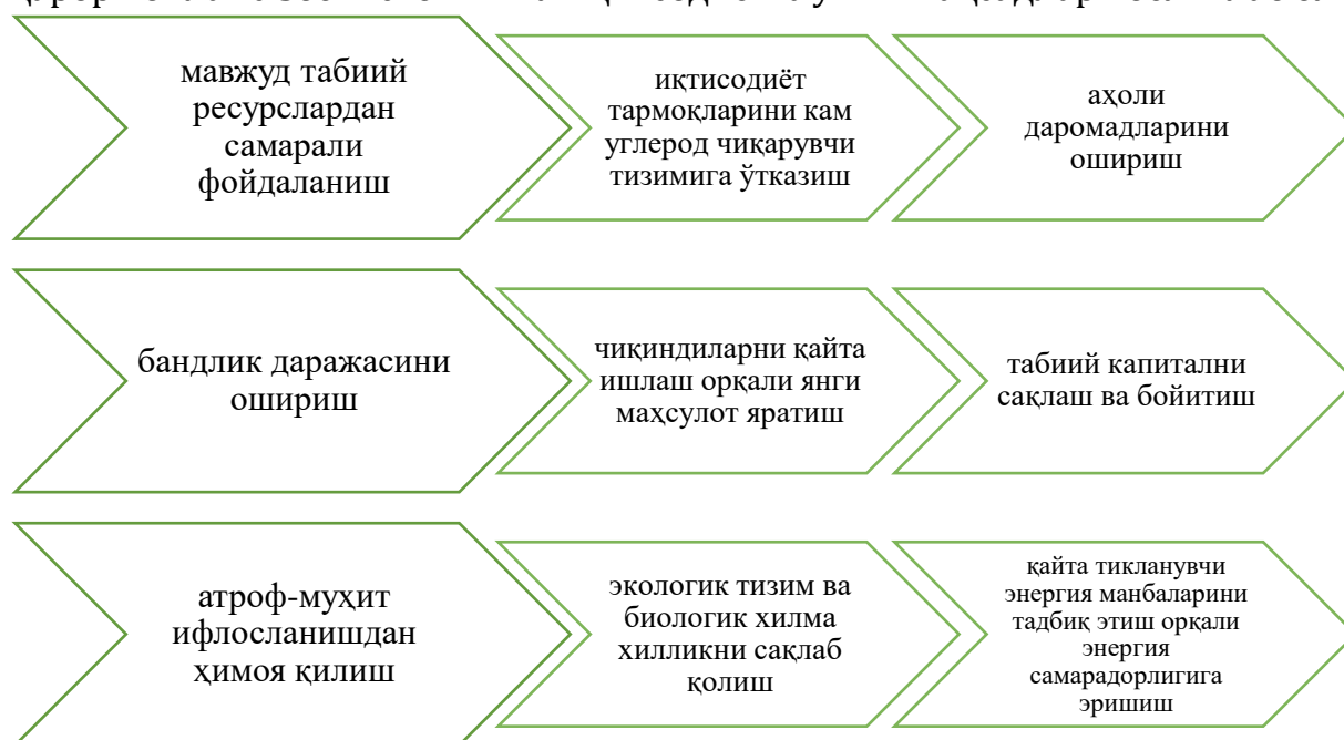
1-расм. “Яшил иқтисодиёт” хусусиятлари

Ўзбекистон Марказий Осиёда биринчиларидан бўлиб яшил иқтисодиётга ўтиш йўналишларини белгилаб олди. Жумладан, Ўзбекистон Республикаси Президентининг 2022 йил 2 декабрдаги “2030 йилгача Ўзбекистон Республикасининг “яшил” иқтисодиётга ўтишига қаратилган ислохотлар самарадорлигини ошириш бўйича чора-тадбирлар тўғрисида”ги ПҚ-436-сон қарори билан Ўзбекистон яшил иқтисодиётга ўтиш мақсадлари белгилаб олинди.