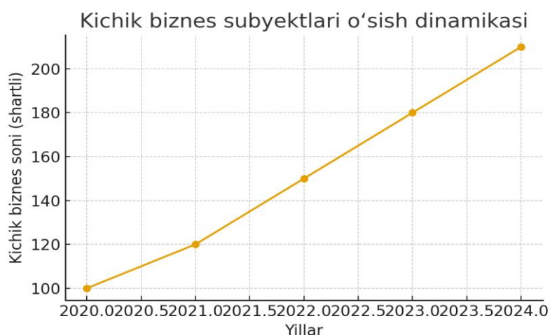
1-rasm. Kichik biznes subyektlari o'sish dinamikasi (2020–2024) [7].