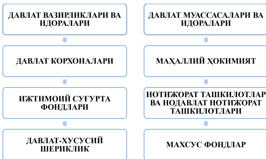
2-расм. Давлат бюджет ташкилотларининг умумий кўриниши

Бюджет ташкилотлари давлат секторида фаолият юритадиган ва давлат товарлари ва хизматларини етказиб бериш учун молиявий ресурсларни бошқариш ва улардан фойдаланиш учун масъул бўлган турли хил субъектларни ўз ичига олади.