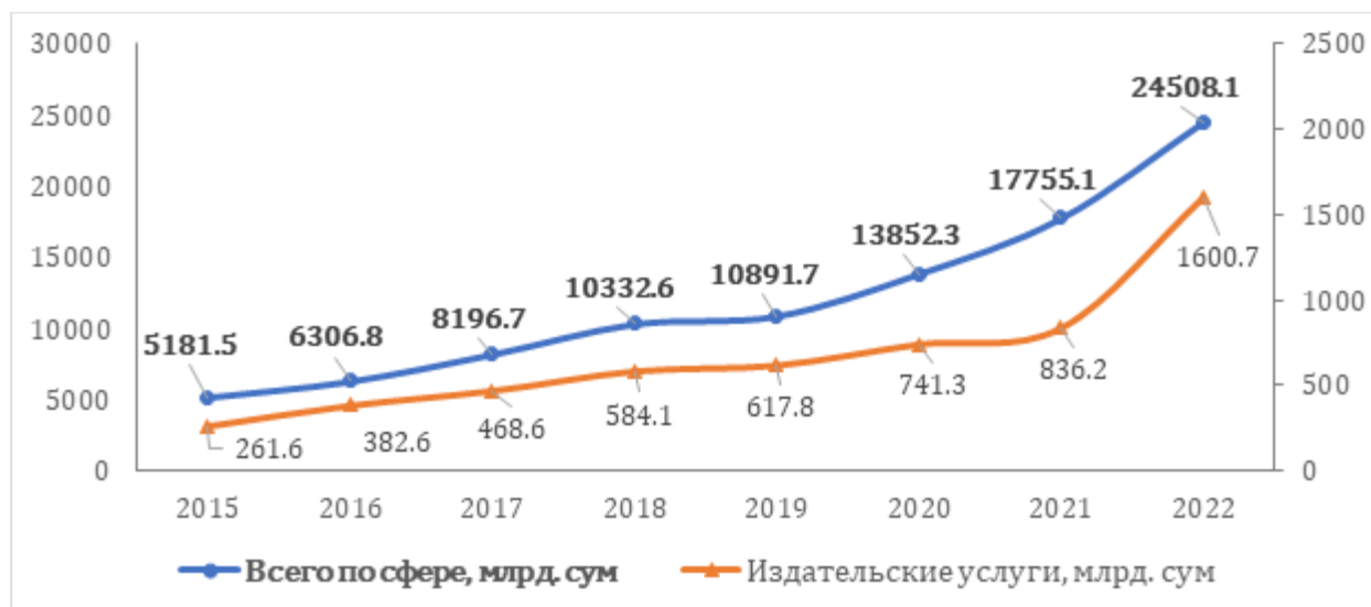
2-rasm. Ko'rsatilgan aloqa va axborotlashtirish xizmatlari hajmining o'sishi

matbaa kompaniyalarining o'zgina pasayishiga qaramay, ko'rsatilgan aloqa va axborotlashtirish xizmatlari hajmining o'sishi kuzatilmoqda (2-rasm).