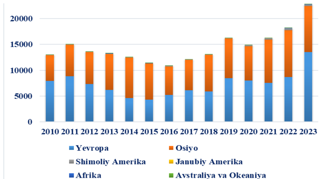
1-rasm. O'zbekiston Respublikasining qitalar kesimida eksport hajmi

Eksportning ayrim bozorlarga haddan tashqari bog'lanib qolishi tashqi savdo xatarlarini kuchaytiradi (Felipe va boshq, 2012). Shu sababli eksport geografiyasini diversifikatsiya qilish iqtisodiy barqarorlik va eksport hajmlarining barqaror o'sishini ta'minlovchi muhim omil hisoblanadi.