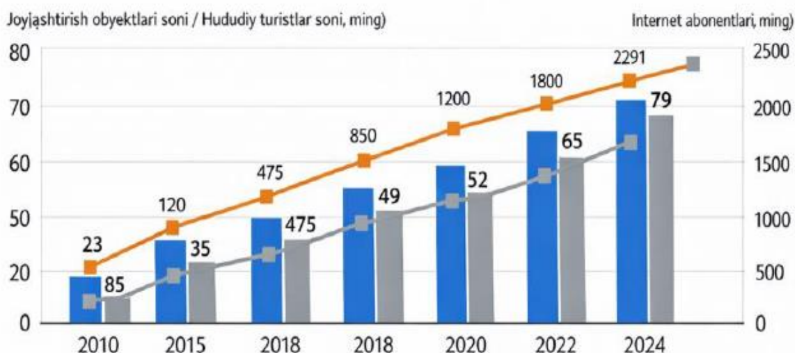
1-rasm. Qashqadaryo viloyatida turizm infratuzilmasi va raqamli rivojlanish ko'rsatkichlari

Tadqiqot ishi natijasida oligan jadval ma'lumotlariga ko'ra Qashqadaryo viloyatida turizm infratuzilmasi va raqamli rivojlanish ko'rsatkichlari o'rtasidagi hududiy bog'liqlikni ko'rsatadi. Ma'lumotlardan ko'rinib turibdiki, internet abonentlari sonining keskin oshishi joylashtirish