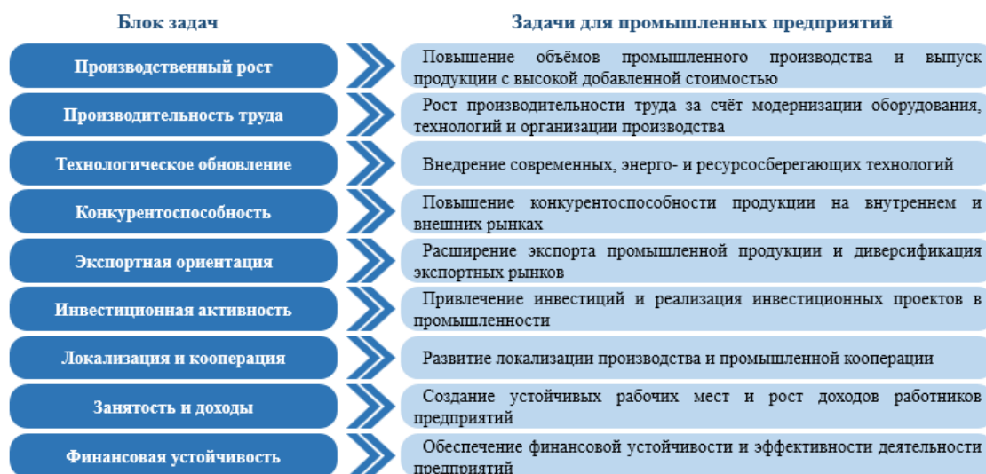
Рис. 1. Задачи промышленных предприятий

«Обеспечение благосостояния населения путем устойчивого экономического роста»