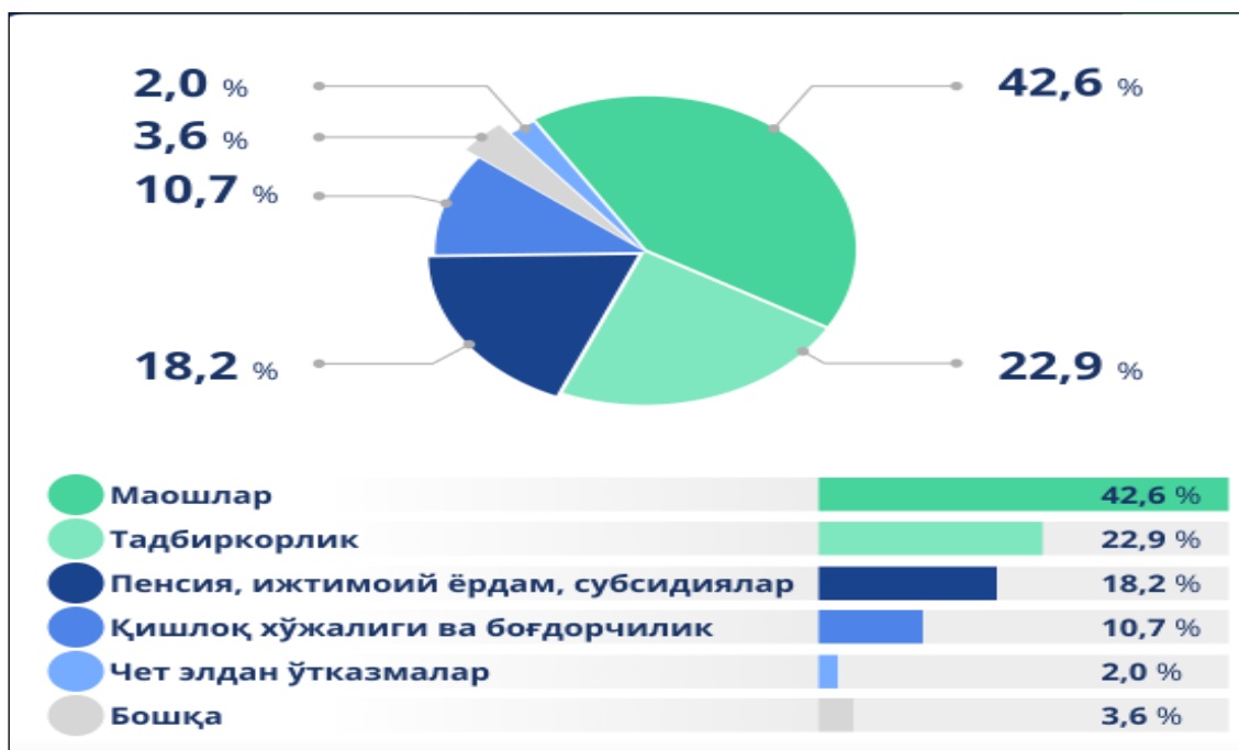
1-расм. Ўзбекистон аҳолисининг 2024 йилдаги даромадлари таркиби

Республикада аҳоли жон бошига ойлик ўртача 2,1 млн. сўмни ташкил қилган. Аҳоли даромадларининг асосий қисмини (умумий ҳажмининг 42% ни) иш ҳақи ташкил қилган. 2024 йилда иш ҳақидан келган даромадлар 12,9% га ошган, бу 5,1 млн. аҳоли бандлиги таъминлангани ва расман ишга жойлаштирилган аҳоли улуши 30%га органи билан боғлиқдир. Аҳолининг пул ўтказмаларидан даромад 2023 йилдаги 3,1% дан 2% га тушган. 2024 йилда нафақалар, ижтимоий ёрдам ва субсидиялар умумий даромад ҳажмининг 18,2% ни, қишлоқ хўжалиги ва боғдорчилик эса 10,7% ни ташкил қилган. Тадбиркорлик фаолиятидан олинган даромадлар 2023 йилга нисбатан 1,5% га ошиб, 22,9% ни ташкил этган (1-расм).